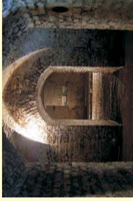
Blickkache durch die letzte erhaltene Kaponniere in Köln