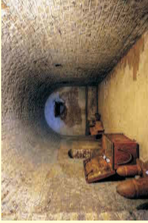
Blick in eine Pulverkammer

Die Instandsetzungsliste ist lang, doch Rückblickend bereits viel geschafft! Wer sich noch an das Festungswerk um 2000 erinnert, hat das Bild einer historischen Ruine im Kopf ringsherum von Vandalismus und Graffiti gezeichnet.