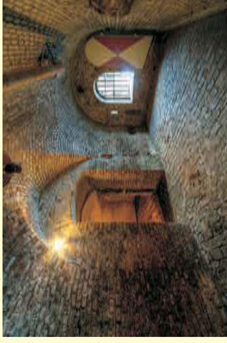
Selbst Tageslicht hat wenig Chancen einzudringen

Wer mehr erfahren möchte ist herzlich eingeladen! Die Öffnungszeiten sind auf der Rückseite abgedruckt – und gearbeitet wird regelmäßig Samstags ab 13.00 Uhr.