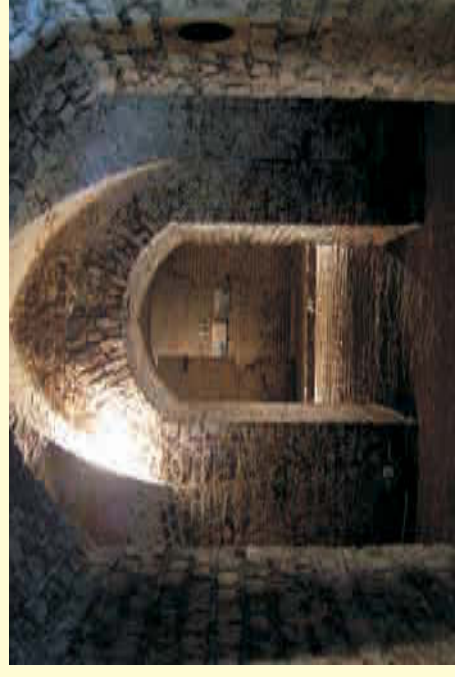
Blickkache durch die letzte erhaltene Kaponniere in Köln